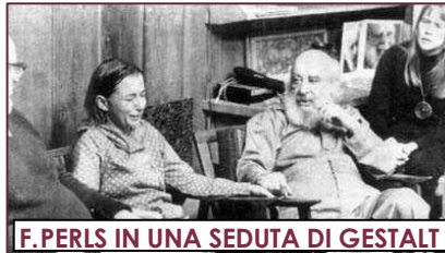
F. PERLS IN UNA SEDUTA DI GESTALT

Si inizierà fornendo delle nozioni generali sull'argomento per poi concentrarci sull'importanza del nostro corpo e di quello dell'altro e di come avviene il contatto durante le sedute. La parte teorica sarà sempre seguita da esperienze guidate che permetteranno di far sedimentare la teoria.